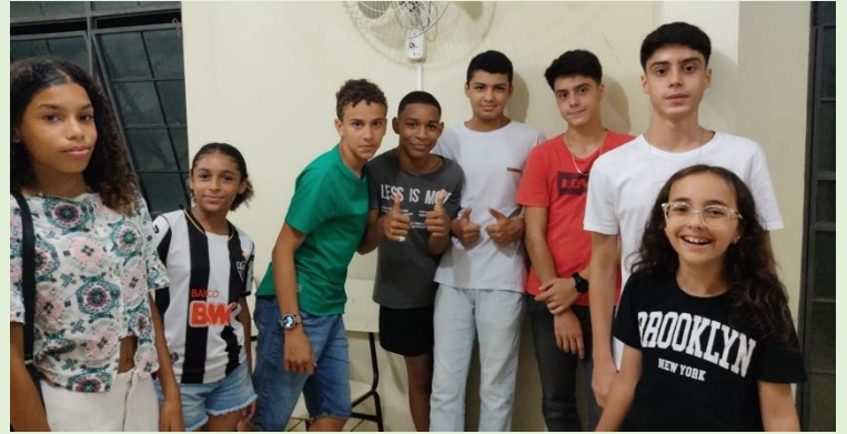
Aniversariantes de Julho a Dezembro