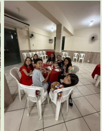
Noite de Pizza – 03/12/24