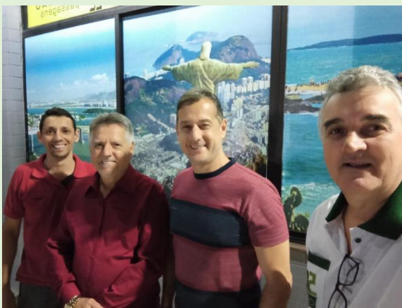
Evangelismo em Realeza 29/04 Foram distribuídos 144 mini bíblias