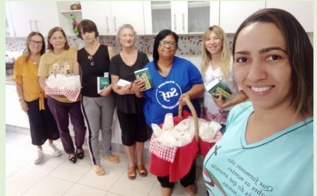
CEF - Cuidando e Evangelizando na Fila 03/05/24 Foram distribuídos 10 Bíblia e 127 folhetos