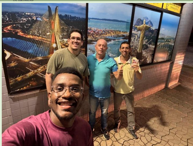
Noite abençoada em Realeza (11/11), com a distribuição de 125 mini bíblias, 2 Bíblias e aproximadamente 280 folhetos.