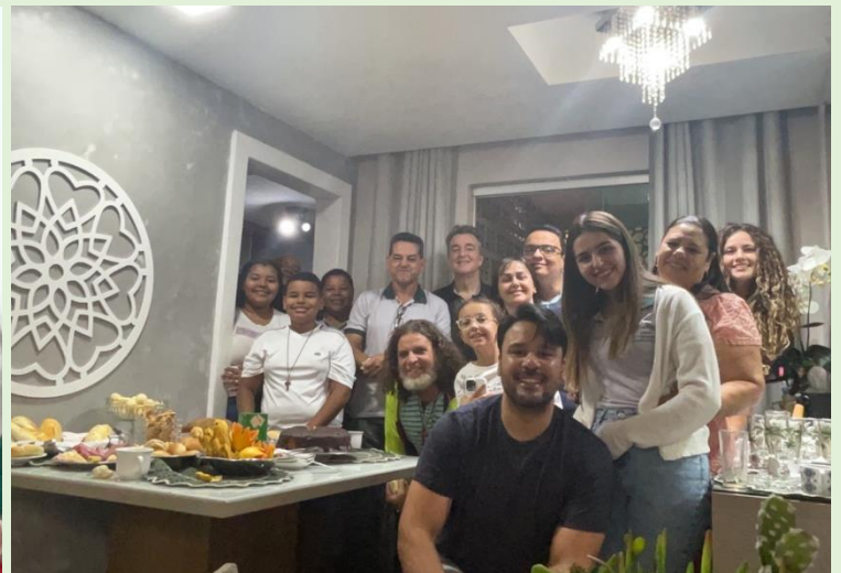
Casa Rosa (28/05)