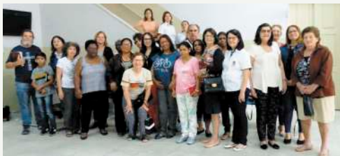
Culto na Prefeitura - 07/10/19