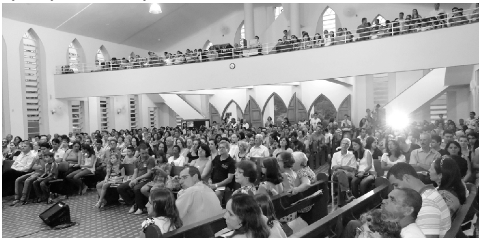
Participantes no Templo da IP Alto Jequitibá

Na parte da tarde, houve um momento de esporte e lazer para adultos e crianças (Futebol, Voley, pula-pula, algodão doce, etc). As refeições (café da manhã, almoço e lanche) foram servidas gratuitamente a todos nas dependências do Centro Social da Igreja hospedeira. Várias UPH's auxiliaram com ofertas previamente solicitadas pela Confederação. Uma atmosfera de alegria, paz, louvor, espiritualidade e comunhão esteve presente em todo o encontro. Deus seja louvado e engrandecido por mais este "baquete espiritual que a família sinodal pôde saborear".