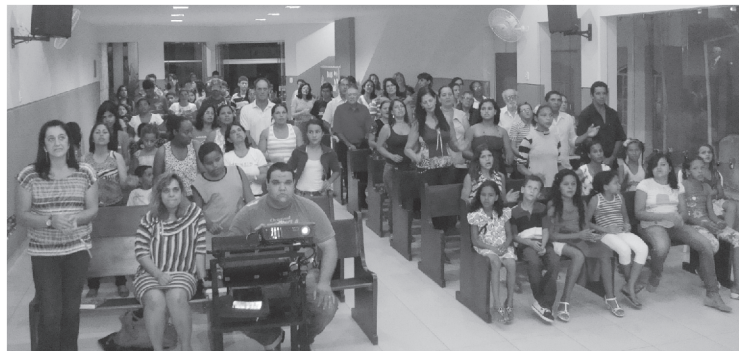
Participantes do Culto