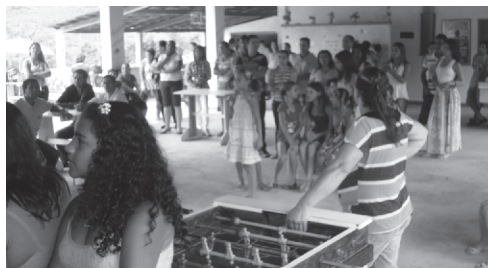
Encontro das Congregações