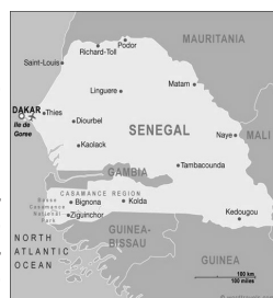
Mapa do Senegal