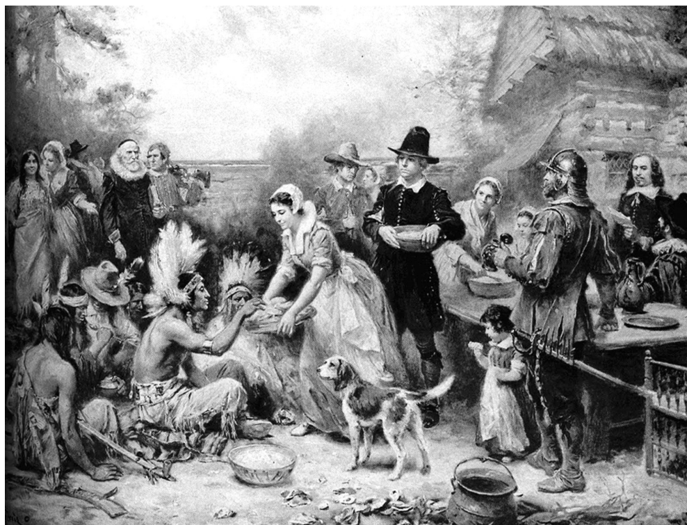
Pintura da Primeira Celebração de Ações de Graças. Jean Louis Gerome