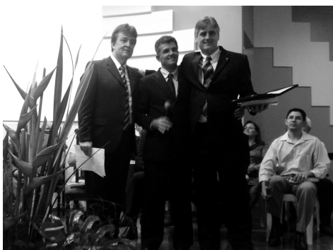
Homenagem da Sinodal de UPH's