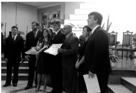
Entrega de Certificado ao Prefeito eleito