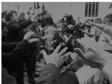
Oração em favor dos eleitos (de joelhos)

Um clima de paz, alegria e harmonia marcaram estes momentos de gratidão, através de cumprimentos fraternais e abraços calorosos. Deus seja louvado.