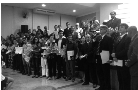
Eleitos e suas esposas à frete do Templo