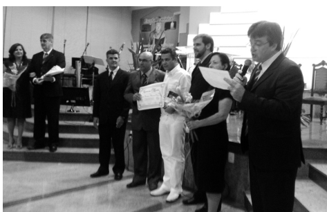
Entrega de Certificado ao Vice-Prefeito eleito