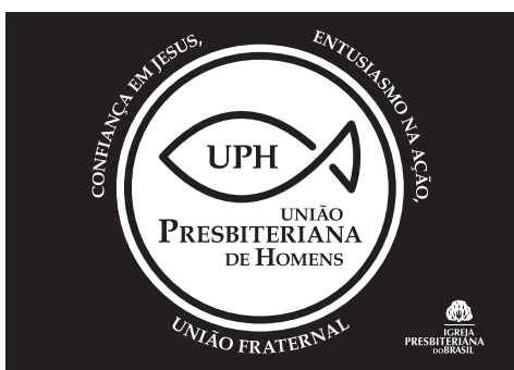
Nova bandeira da UPH