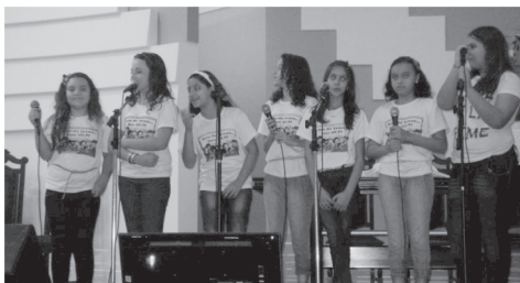
Grupo vocal de crianças