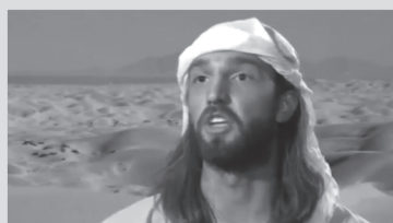
Cena do Filme

trazendo prejuízo a todos nós. Pedimos que orem por nós e por todos os cristãos que vivem em comunidades muçulmanas. Em Cristo.