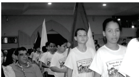
Entrada das Crianças