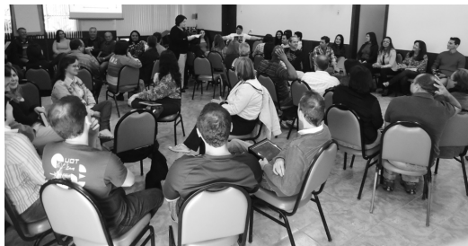
Dinâmica sobre comportamento humano