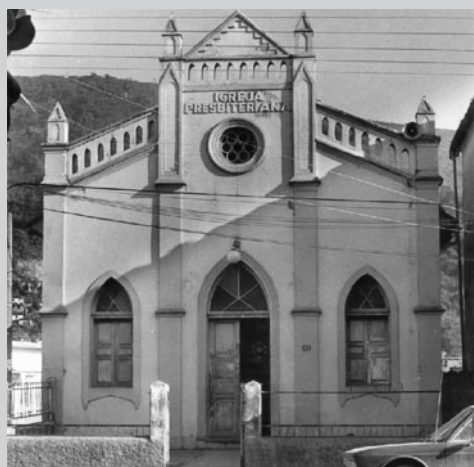
2º TEMPLO REMODELADO - 1928