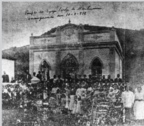
2º TEMPLO - 1912