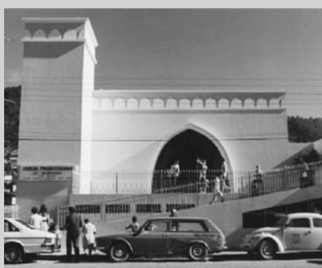
3º TEMPLO - 1980