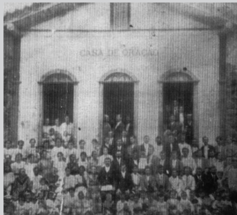
1º TEMPLO - 1905