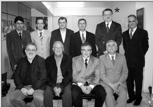
Diretora / Assembléia APMT