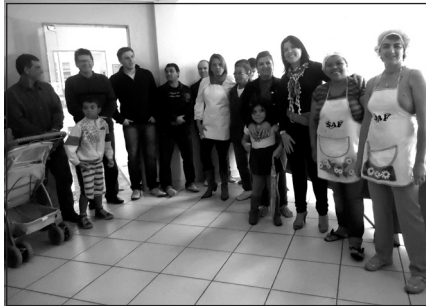
Homenagem às cozinheiras