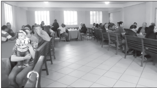
Participantes do almoço