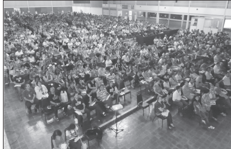
Auditório do VI CBM

Na realidade foram tempos de reflexão sobre atualíssimos temas missiológicos, uma ampla visão de uma igreja evangélica brasileira forte e a percepção do grande desafio como disse Josué: “Ainda há muita terra para ser conquistada”.