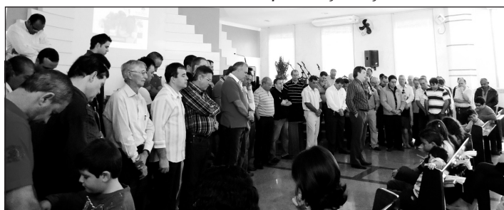
Momento de oração em gratidão e intercessão pelos pais