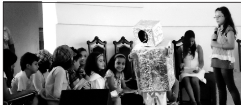
Apresentação Peça Teatral