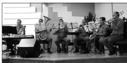
Sexteto da Banda de Música