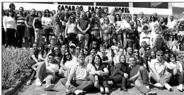
Casais participantes do Encontro

Cada casal recebeu uma linda lembrança na chegada. Igreja, Deus ouviu as nossas orações.