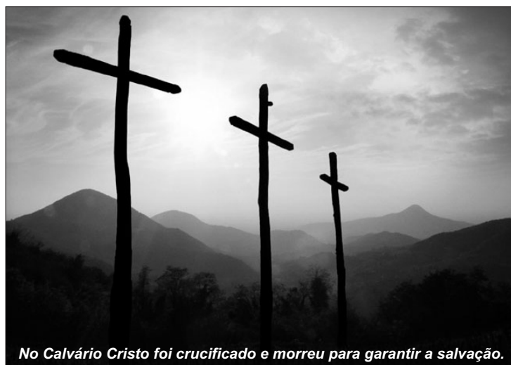
No Calvário Cristo foi crucificado e morreu para garantir a salvação.

Quarto, há a dupla validação do evangelho. Por um lado, há o testemunho do Antigo Testamento sobre o Messias (v. 44, 46), e do outro a afirmação: “você [os apóstolos] são testemunhas destas coisas” (v. 48). Assim, a morte e ressurreição de Jesus são atestadas duplamente no Antigo e no Novo Testamentos.