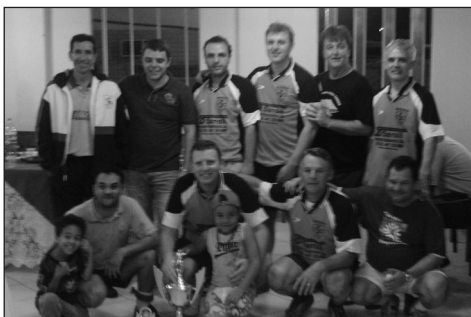
Equipe vencedora da IPM