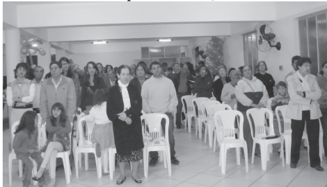
Representações da igreja e congregações