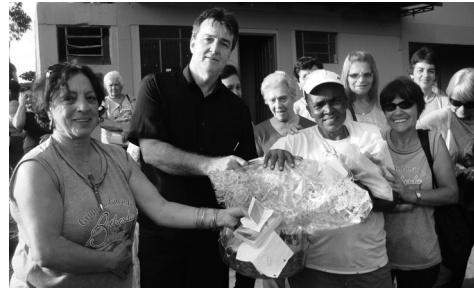
Mãe mais idosa - entrega de cesta especial