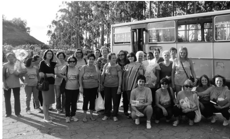
Grupo de Ginástica Bethesda