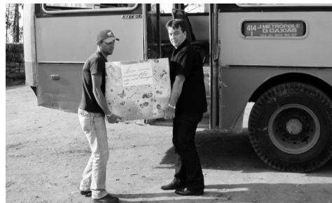
Caixa com os kits