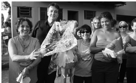
Mãe mais jovem - entrega de cesta especial