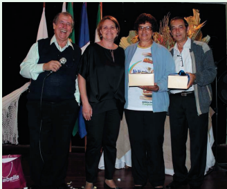
Homenagem aos Missionários