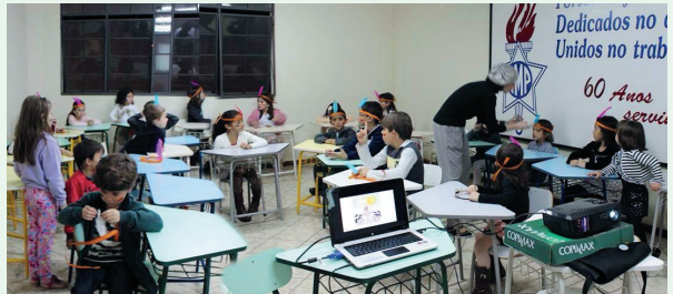
Chá Missionário Infantil