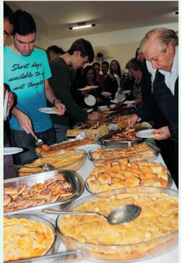
Serviço - Salgados

Aconteceu no sábado e no domingo, dias 16 e 17 de agosto/14, programações missionárias, com o objetivo de ampliar a nossa visão missionária e levantar recursos para investir em missões. O Chá Missionário para Adultos e Infantil aconteceram no sábado, bem como palestras pelo Pr. e Miss. Gervásio, da Missão Caiuá – Dourados-MS. Houve muita comunhão, fartura, alegria e doações. As palestras do Miss. Gervásio foram esclarecedoras e desafiadoras quanto a necessidade da Igreja investir mais em missões indígenas. Ficou claro que é grande a carência de obreiros, de recursos e pessoas para atuar na tradução da bíblia para os índios. Fomos desafiados a acordar e apoiar a evangelização entre os povos indígenas. Parabenizamos a SAF pela organização geral do Chá Missionário, aos que doaram, aos que compraram os convites e a toda igreja que apoiou de forma incondicional. Deus seja louvado!