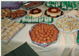
Mesa de Salgados