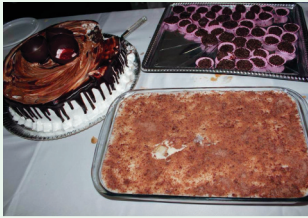
Mesa de Doces