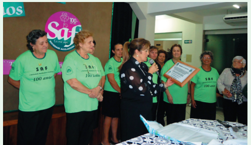
SAF IP Alto Jequitibá