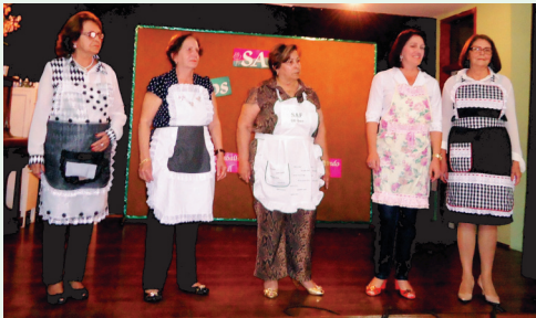
Desfile de Aventais