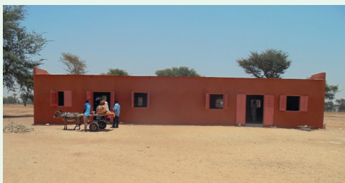
Faixa do Novo Templo