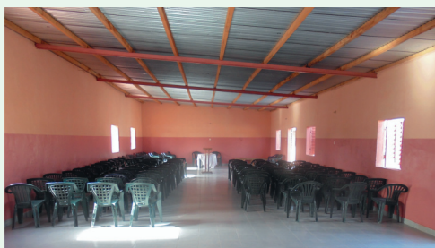
Vista Interna do Novo Templo