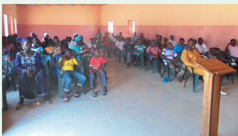
Participantes do Culto de Inauguração