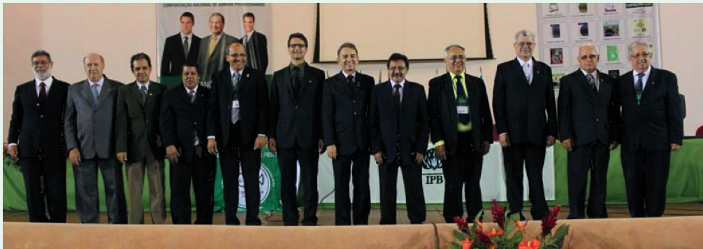
Diretoria CNHP - 2014 / 2018