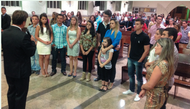
Novos membros recebidos pela IPM