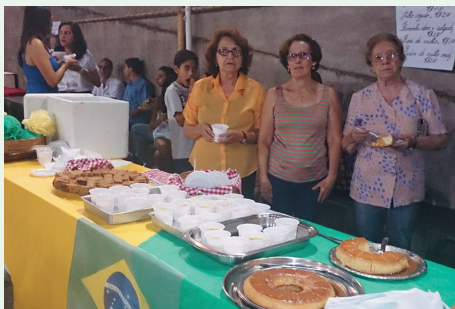
Mulheres da SAF