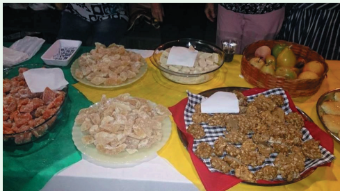
Produtos Típicos da Roça