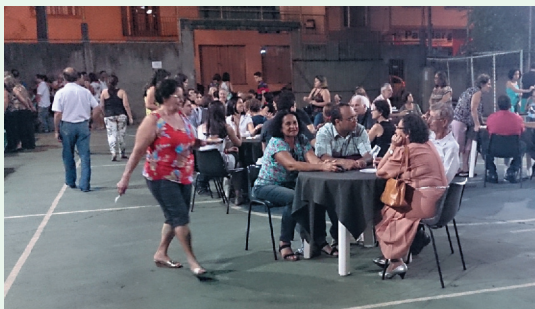
Participantes no Estacionamento / Quadra