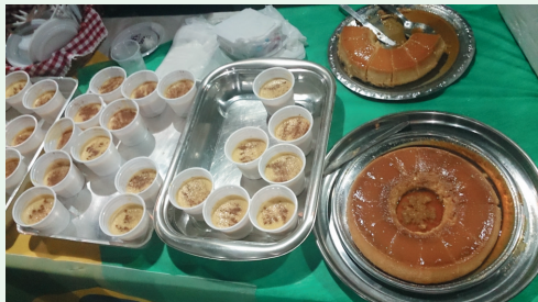
Produtos Típicos da Roça