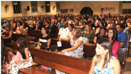
Culto da Noite - 09/03