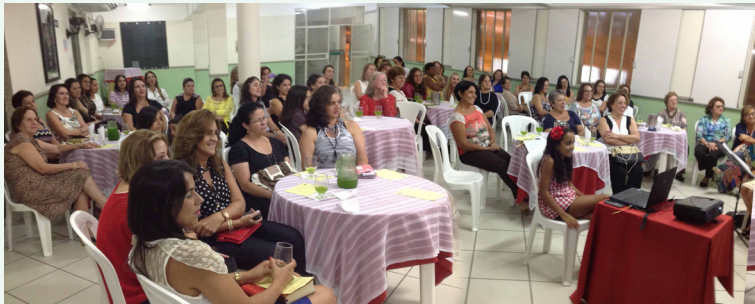
Encontro de Mulheres - 08/03

Nos dias 08 e 09 de março a IPM comemorou de forma intensa, alegre e participativa o Dia Internacional da Mulher. Um café da manhã, caminhada pela cidade com distribuição de folhetos, encontro de mulheres e um belo culto de gratidão fizeram parte das comemorações. A SAF distribuiu pela cidade 5mil cópias de uma linda mensagem enaltecendo o valor da mulher. Um agradável encontro de mulheres aconteceu no salão da IPM, quando muitas foram desafiadas a se tornarem sócias da SAF. No domingo à noite, dia 09/03, foi celebrado culto de gratidão com a participação do Grupo Musical D6-Si Arte. Foi um culto musical que tocou o coração de Deus e das mulheres. Ao final do culto o Rev. Anderson leu na tradução da Bíblia Contemporânea o texto de Salomão sobre a Mulher de Muito Valor: Provérbios 31. 10-31. Mais uma vez: parabéns mulheres, vocês são especiais. São exemplos de amor e superação.