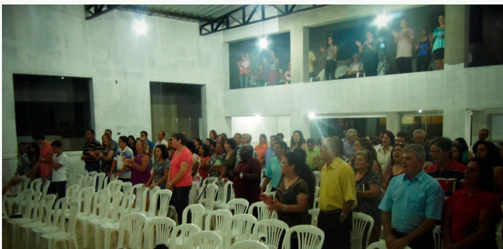
Participantes do Culto