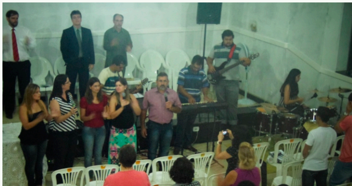
Ministério de Louvor - IP em Santa Margarida