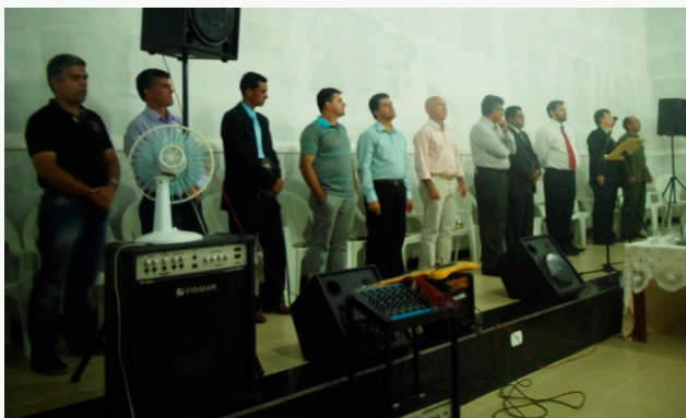
Pastores e Evangelistas no Púlpito