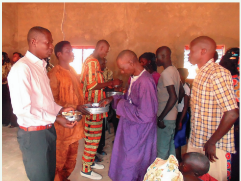
Celebração da Santa Ceia