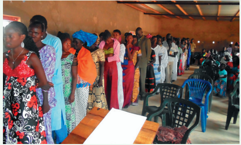
Fila de pessoas a serem Batizadas