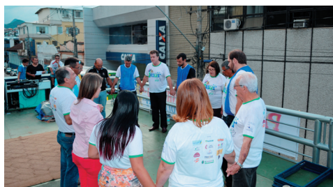
Oração preparatória para caminhada