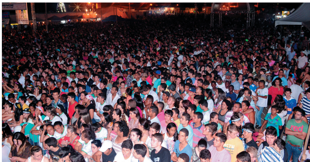
Público no Parque de Exposição (Culto de Encerramento da Feira da Paz - 136 anos de Manhuaçu)