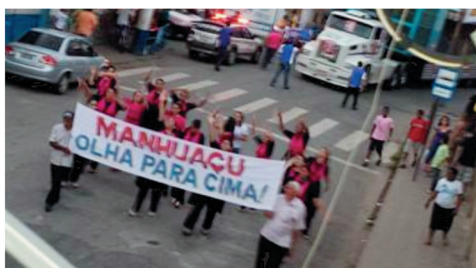
Faixa de Abertura