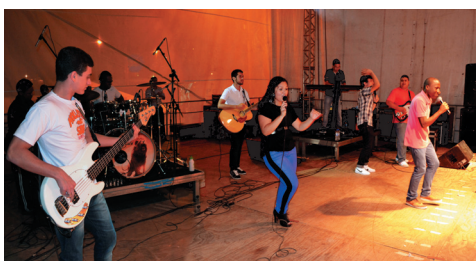
Banda Unidade na Fé