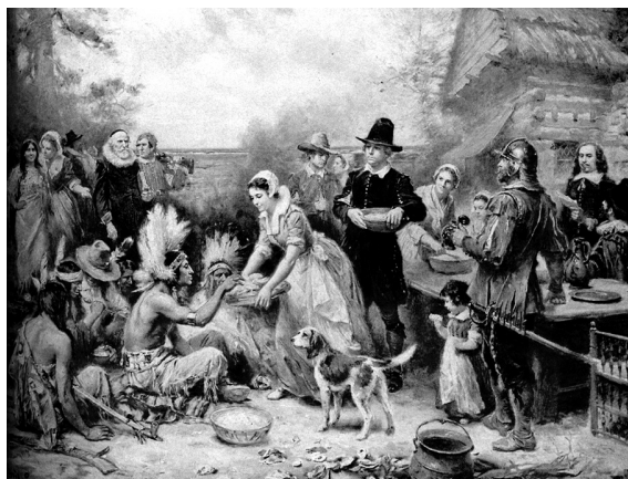
Pintura da primeira celebração de Ação de Graças.

O primeiro Dia de Ações de Graças foi celebrado em Plymouth, Massachusetts, pelos colonos (102 crentes que, devido às perseguições religiosas, emigraram no navio MAYFLOWER, da Inglaterra para os Estados Unidos) que fundaram a vila em 1619. Eram chamados de puritanos. Após péssimas colheitas e um inverno rigoroso, os colonos tiveram uma boa colheita de milho no verão de 1621. Por ordem do governador da vila uma festividade foi marcada no início do outono de 1621. Os homens de Plymouth mataram patos e perus. Outras comidas que fizeram parte do cardápio eram