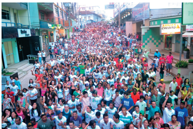
Povo de Deus caminhando pela Paz