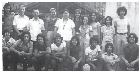
Conjunto Testemunhas de Cristo (IP Alto Jequitibá)