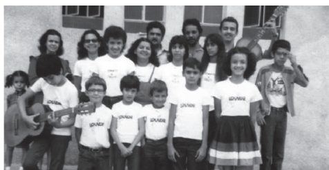
Grupo Sementes de Cristo (Congregação Matipó)