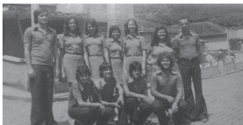
Equipe Testemunhas de Cristo (IP Alto Jequitibá)