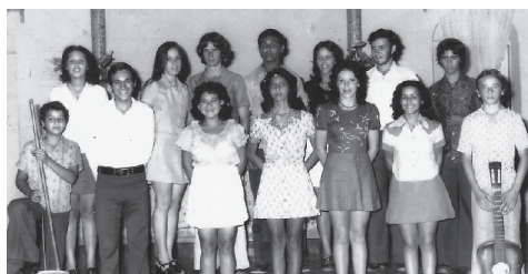
Cristo Liberta (IP Lajinha)