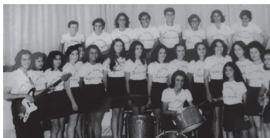
Cristo Liberta (IP Lajinha)