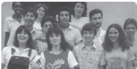
Conjunto Sinal de Alerta (IP Manhuaçu)