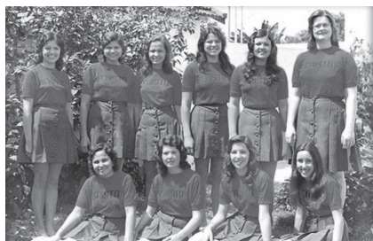
Cristo é Real (IP Carangola)