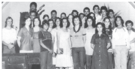
Conjunto Testemunhas da Verdade (IP Manhuaçu)