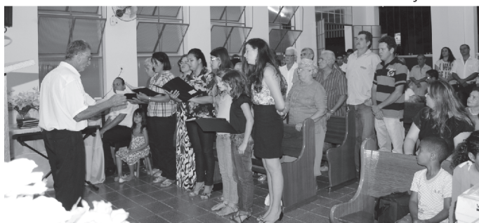
Coral da IP Mantimento