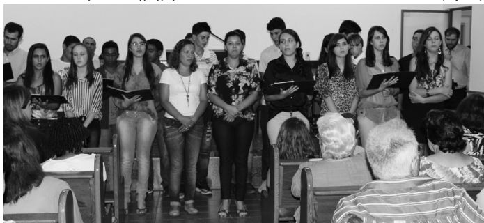
Conjunto El-Shaddai - IP MANTIMENTO