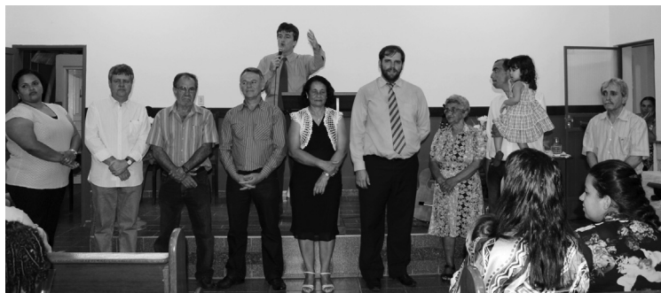
Comissão de Obras e Liderança da Congregação