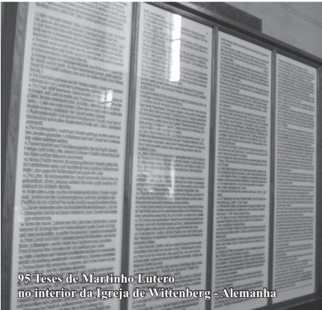
95 Teses de Martinho Lutero no interior da Igreja de Wittenberg - Alemanha