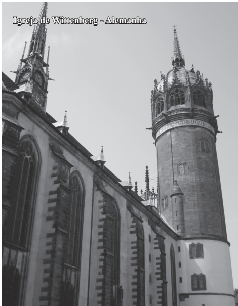
Igreja de Wittenberg - Alemanha