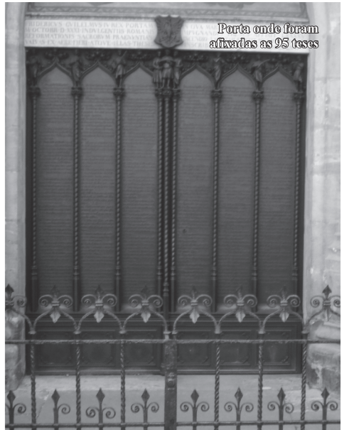
Porta onde foram afixadas as 95 teses