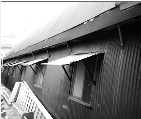
Parte lateral da “Igreja de Lata”