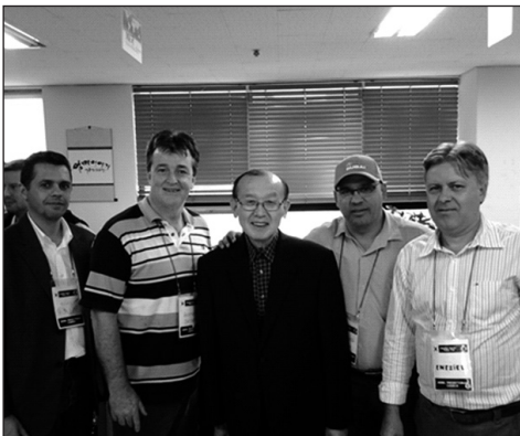
Pastor fundador da Igreja (ao centro)