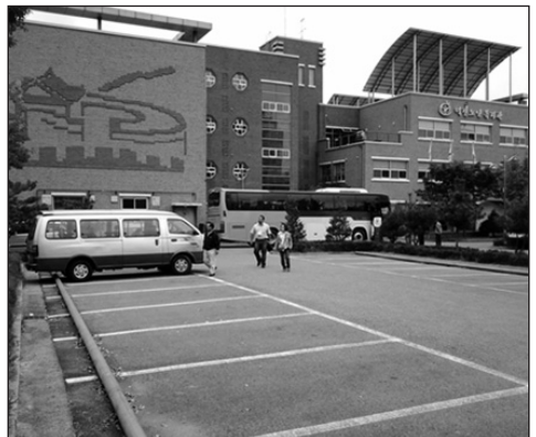
Prédio doado pela Prefeitura