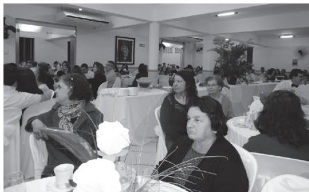
Participantes do Chá Missionário