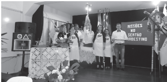
Equipe da SAF e alguns garçons