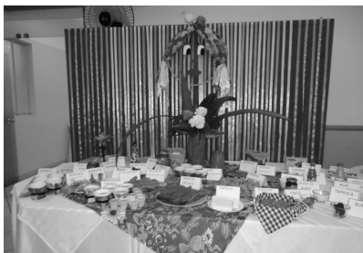
Mesa de Comidas Típicas do Nordeste