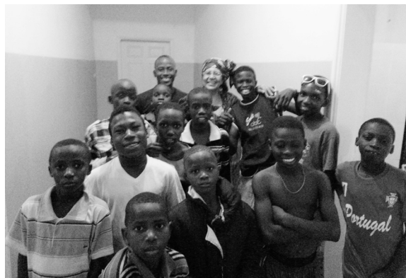
Crianças do Projeto Obadias