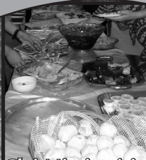
Chá Missionário (Adulto e Infantil)