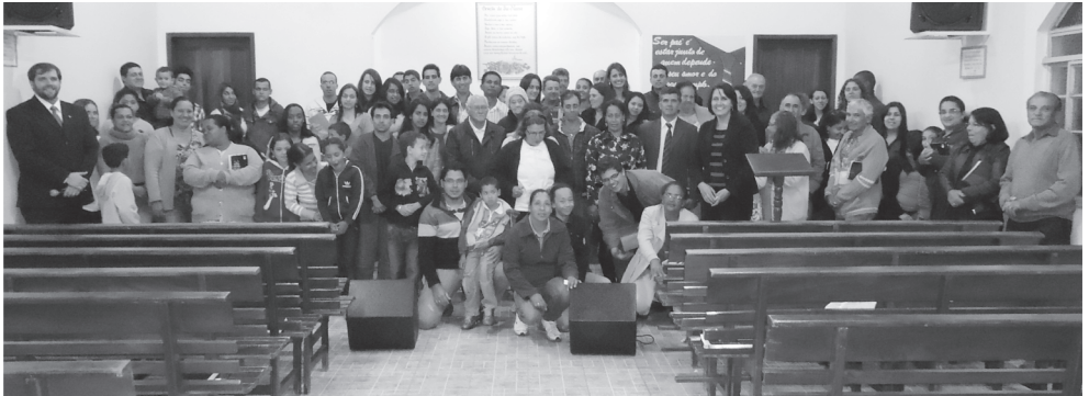
Congregação Monte Sião - Participantes do Culto de Ações de Graça e Despedida do Templo - Dia 18/08