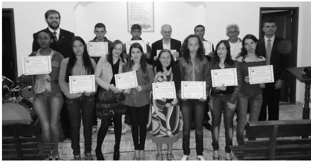
Novos membros recebidos dia 04/08