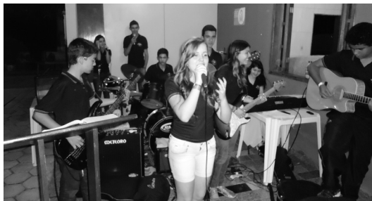
Grupo Guerreiros do Futuro