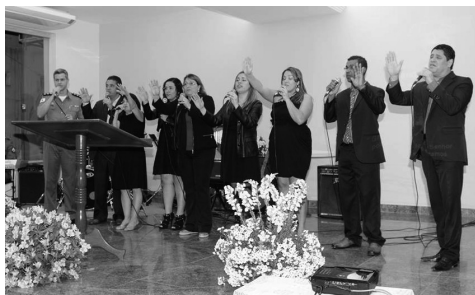
Grupo Som de Adoradores da 1ª Igreja Batista