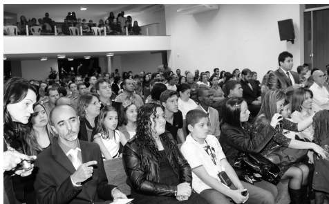
Participantes do Culto