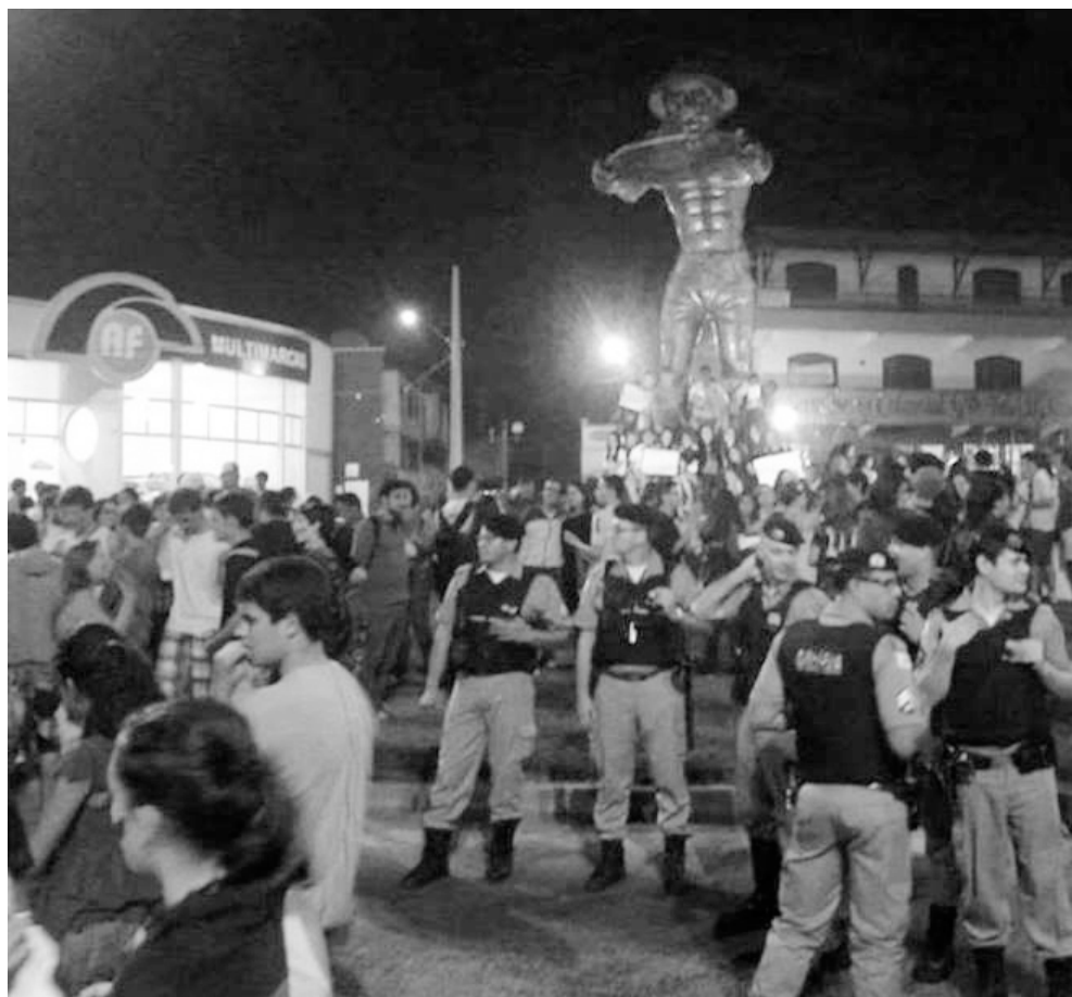
Manifestação Pacífica no Trevo do Cafeicultor em Manhuaçu - Br262 - Dia 26/06/2013