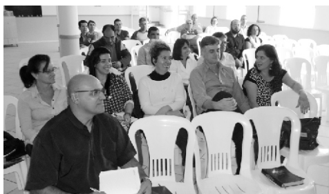
Participantes da Palestra