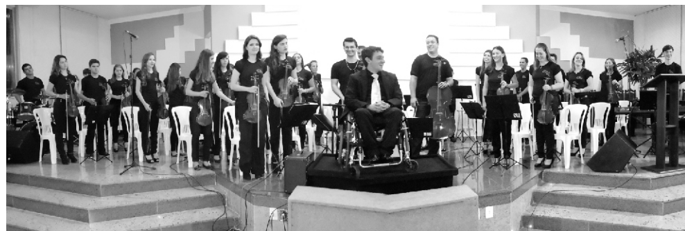
OPAC - Orquestra Presbiteriana de Alto Caparaó