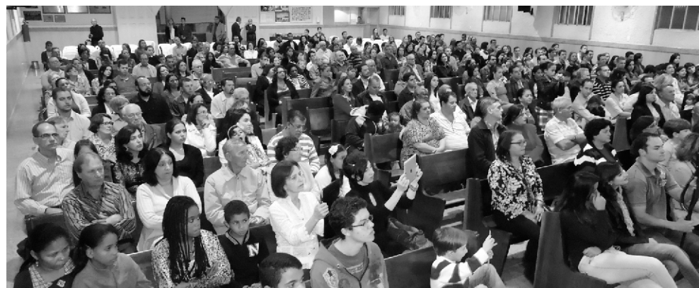
Participantes do Culto a noite