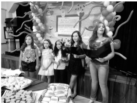
Homenagem da UCP