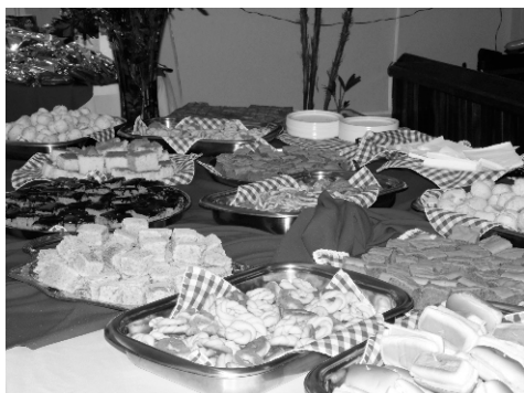
Mesa do lanche