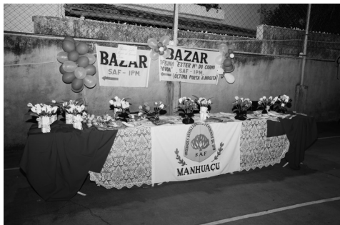
Stand da Oficina

Parabenizamos a Diretoria, as relatoras dos departamentos, todas as sócias e demais pessoas que cooperaram para o êxito desta programação.