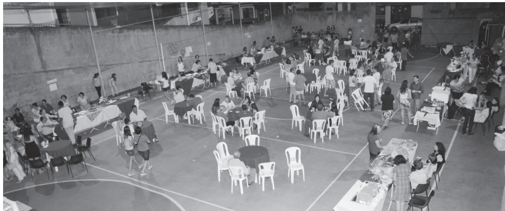
Vista Panorâmica da Festa