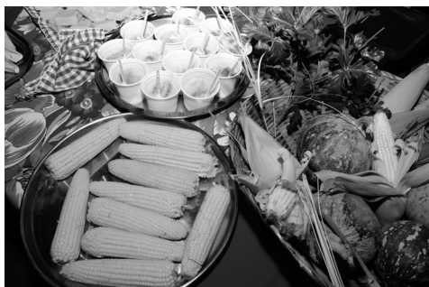
Produtos típicos da Roça