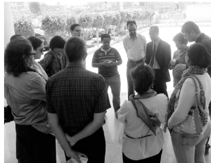
Oração de gratidão no tribunal após notícia da liberdade