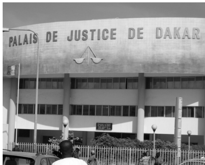
Tribunal de Justiça de Dakar