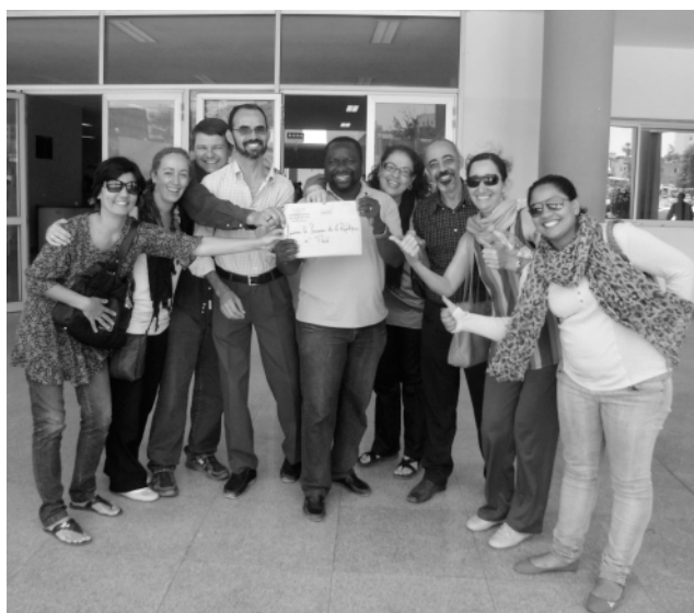
Equipe com documento do Juiz em Dakar