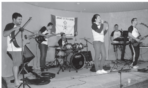
Banda “Coração de Adoração”