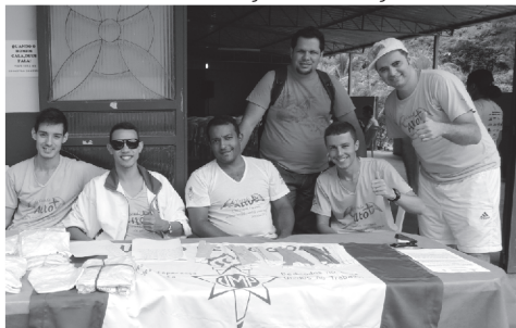
Diretoria da Federação de UMP's