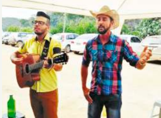
Louvor - Mineirinhos de Deus