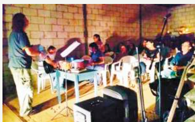
Culto da colheita