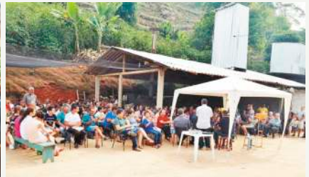
Vista geral - Participantes