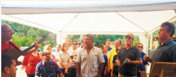
Participação Caravana - II Viagem Missionária