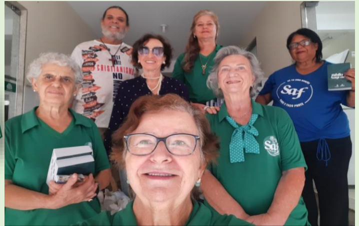
CEF – Cuidando e Evangelizando na Fila (31/01/25) Foram distribuídos 100 Folhetos e 11 Bíblias