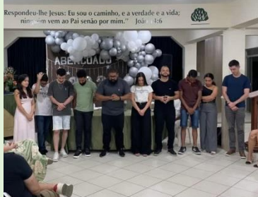
Respondeu-lhe Jesus: Eu sou o caminho, e a verdade e a vida; ninguém vem ao Pai senão por mim." João 14:6