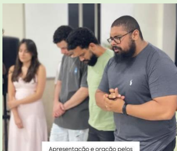
Apresentação e oração pelos irmãos das Secretarias da UMP