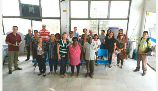
Culto na Prefeitura - 02/04/18