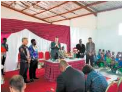
Celebração Santa Ceia - Domingo 18/03