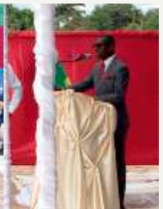
Palavra Rev. Ngula