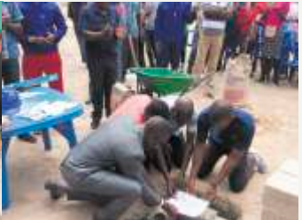
Colocação documentos na caixa