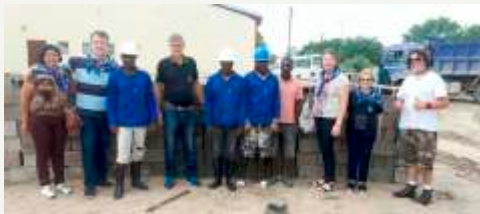
Material Construção - Blocos