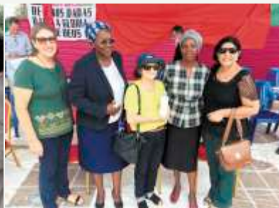
Mulheres da IPM com autoridades do Cunene