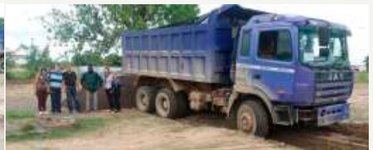
Material Construção - Brita