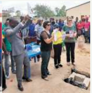
Colocação documentos na caixa