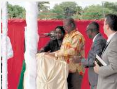
Palavra do Governador em exercício