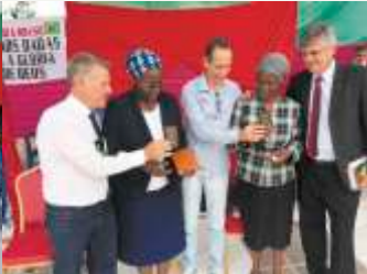
Entrega NT dos Gideões