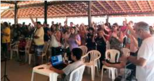
Momento de Louvor e Adoração