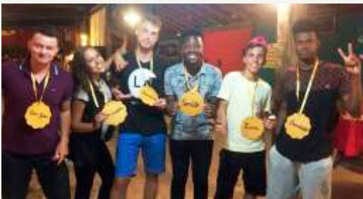
Momento de recreação e descontração