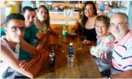
Preletora Veranice e esposo