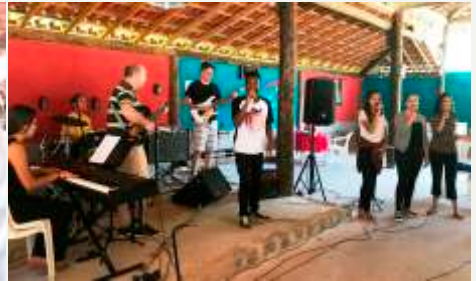
Equipe de Louvor - Ministração