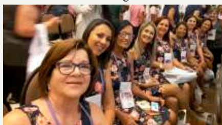
Algumas representantes da Sinodal Leste de Minas

Encerra hoje em Gramado-RS o Congresso Nacional de SAFs. Oremos pelo retorno de todas as irmãs às suas igrejas e famílias. Que a IPB seja mais abençoada através das decisões deste congresso.