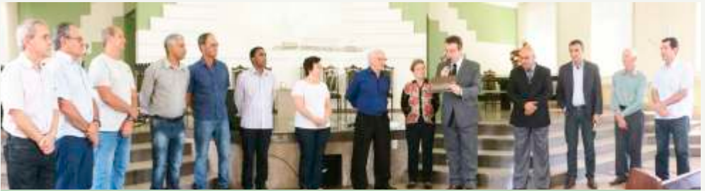
HOMENAGEM DA IGREJA PRESBITERIANA DE MANHUAÇU