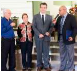
HOMENAGEM DA AMEM