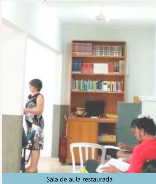
Sala de aula restaurada

mãos por ocasião da 1ª Viagem Missionária IPM já foi aplicada na restauração da sala de aula. Deus continue abençoando este local.