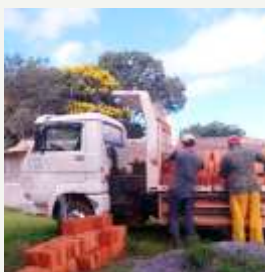
Chegada material para rede esgoto

O Ministério de Missões encaminhou ao Desafio Jovem de Brasília uma oferta no valor de R$ 3.700,00, para auxiliar na construção de uma rede de esgoto. Conforme fotos abaixo o material já está sendo colocado no local para a execução da obra. A oferta entregue em