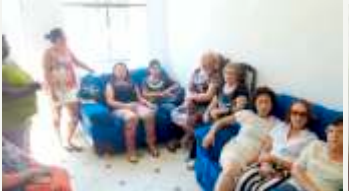
Participantes do Culto