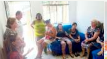
Participantes do Culto