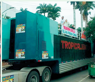
Carro de Som