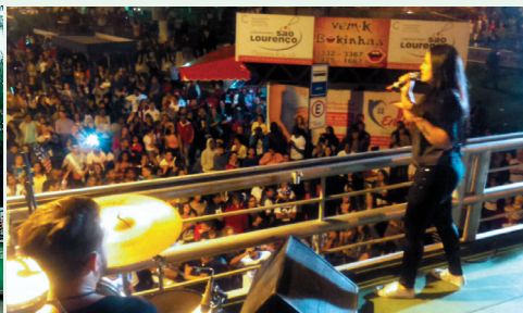
Adoração: Cantora Perlla