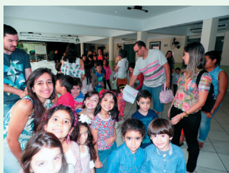
Saída para o Bondinho