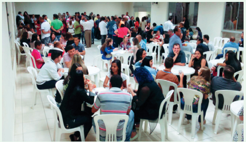
Salão Social: Coffee Break