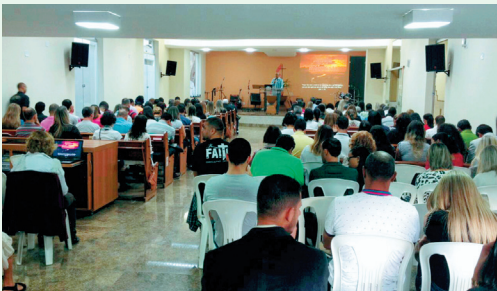
Templo: Ministração Palestra

Cerca de 200 inscritos participaram desta conferência que teve como tema LÍDERES TRANSFORMADOS. Os que participaram integralmente receberam Certificados. Foram momentos de grande aprendizado e despertar ministerial, onde o preletor cuidou de desafiar a cada líder a continuar investindo bem em si mesmo, para cuidar bem do rebanho. Deus seja louvado!